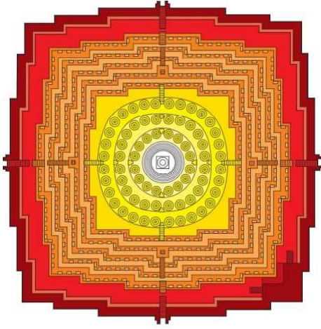
■ Kāmadhātu 赤:欲界 ■ Rūpadhātu 橙:色界 ■ Arūpadhātu 黄:無色界

ボロブドゥール遺跡は大きく三層構造になっている。下段より欲界（欲望にとらわれた世界）、色界（欲を離れているものの物質的にとらわれる世界）、無色界（物質の世界を超えた純粹に精神的な世界）と上部に登るにつれてさとりに近づき、ことをイメージさせる構造となっているようだ。