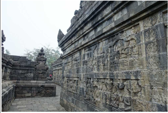
レリーフの彫られた回廊

であると答えが返ってきた。一通り学んで自分に合った仏教を選ぶのである。現在の仏教徒は人口のわずか1%程度であるが、今も真摯な修行者と信者の姿があり、形は違えど同じ仏教者の姿に心が和んだ。 以上、ボロブドゥールの報告。 あとはバリ島に寄り帰路へ。 終