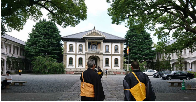
会場の龍谷大学大宮学舎(重要文化財)

歳代から高齢の方は八十歳代まで、全国各地から百名を超える僧侶が集まり二週間にわたって開催されます。