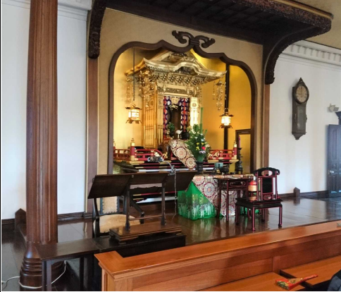
講堂にはご本尊と講義台

本願寺安居は龍谷大学大宮学舎本館講堂(NEA大河ドラマ「いだてん」で東京高等師範学校として映っている建物)を会場として、毎朝七時過ぎより勤行があり、その後、学徳兼備の講師和上より三コマの講義、その後、問者と答者に分かれ議論をしながら理解を深める会読(かいどく)が行われます。若い者は二十