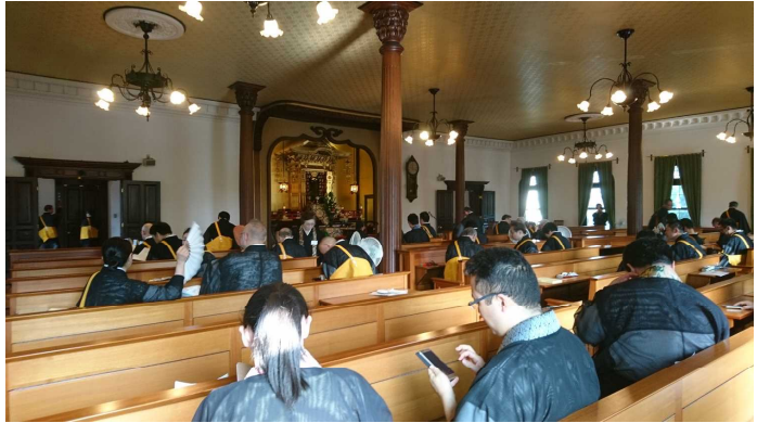
安居最終日、講義前の講堂内

関西空港からガルーダインドネシア航空を利用し、バリ島で乗継ぎ、ジョグジャカルタの空港まで行かなくてはならない。夏休み後半と言うこともあり、バリ島までの機内は若い日本人が多いのであるが、そこからの乗継ぎとなる。日本人の姿はほぼ見なくなる。国際線ターミナルを出て国内線乗継ぎの手続きを済ませ飛行機を待つが一向